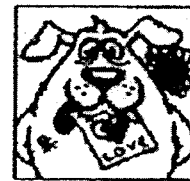
El Perro Enamorado